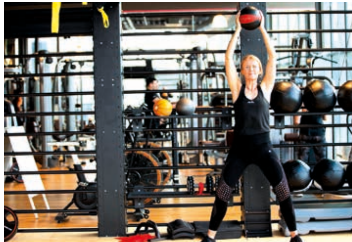
wegung.

Erst recht in diesem Jahr, denn die Nummer eins der Region in Sachen Wellness, Fitness und Gesundheit feiert Yippieläum. 45 Jahre überzeugt das Schwetzingen Unternehmen nicht nur mit Tradition, sondern auch mit Qualität, Kompetenz und Vielfalt. Jetzt wird Lay-C abgeschüttelt, Fiffy an die Leine genommen und mit Bock geht es ran an die Be-