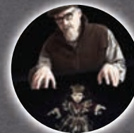
Emons-Verlag GmbH Regie: Christian Lange